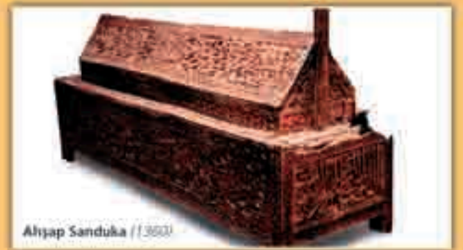
Ahşap Sanduka (1300)