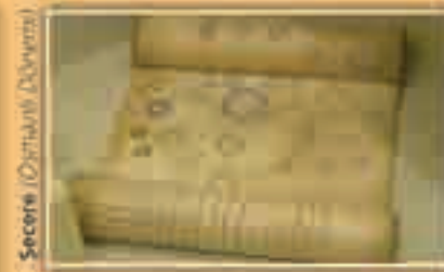
Secere (Köznarlı Dönem)