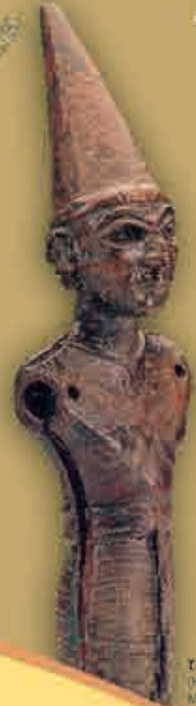
Teşhup Heykeliçigi (Hitit Dönemi M.O. 14-12. yy.)