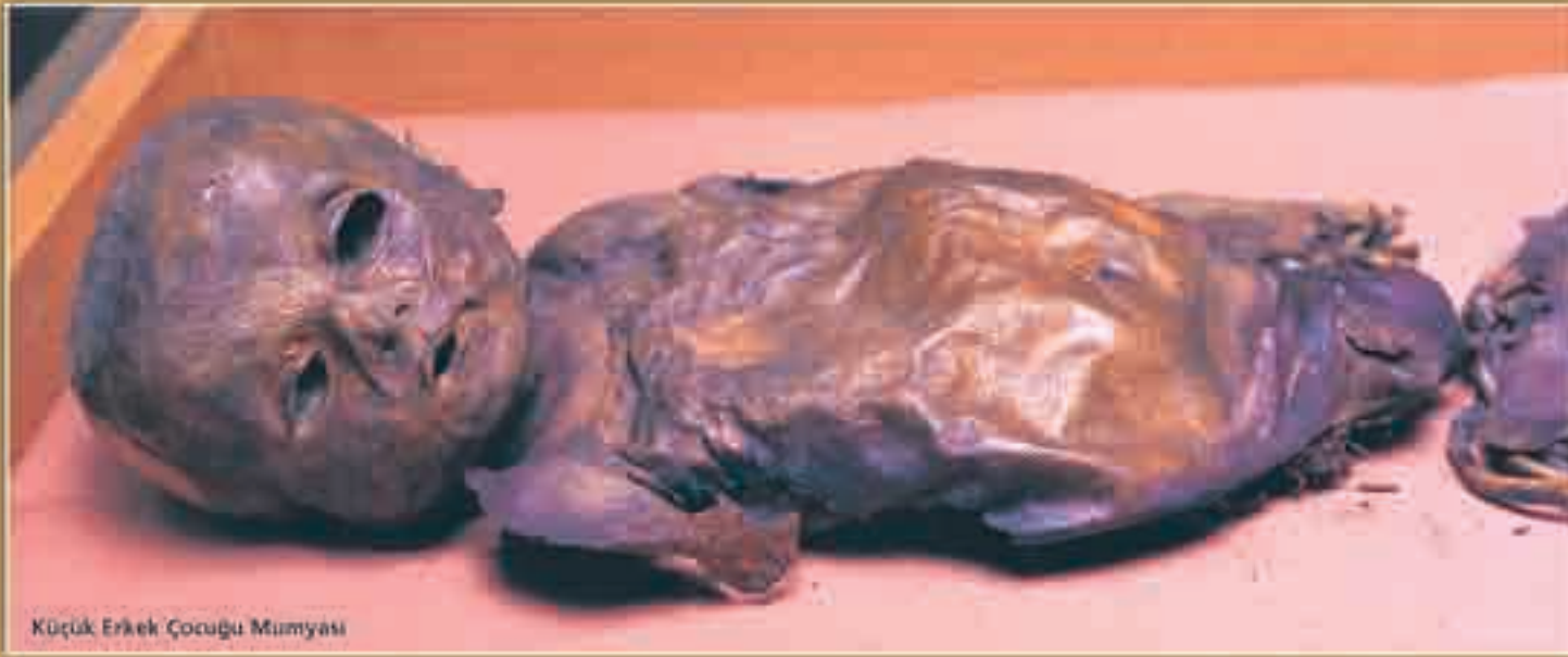
Küçük Erkek Çocuğu Mumyası