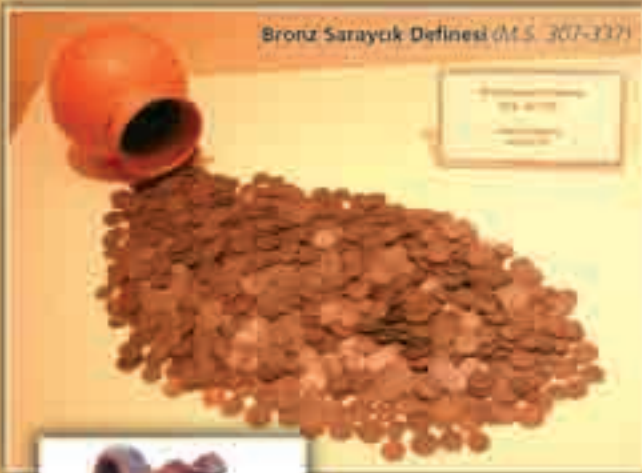
Bronz Sarayık Definesi (M.S. 307-337)