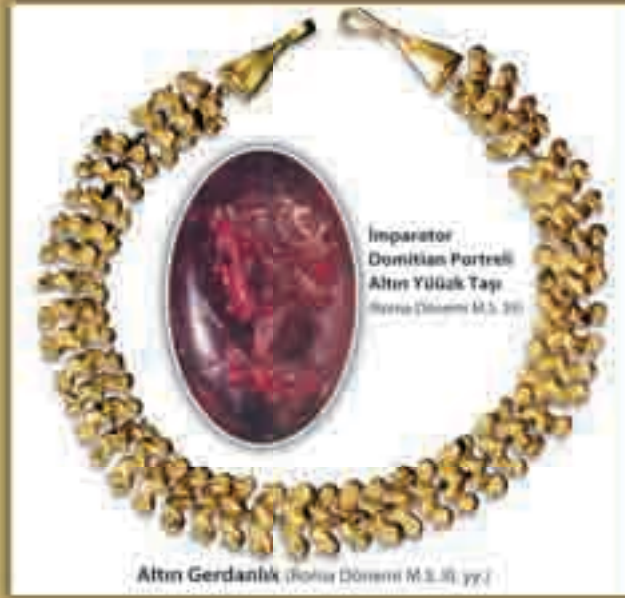
Altın Gerdanlık (Roma Dönemi M.S. 81. yy.)