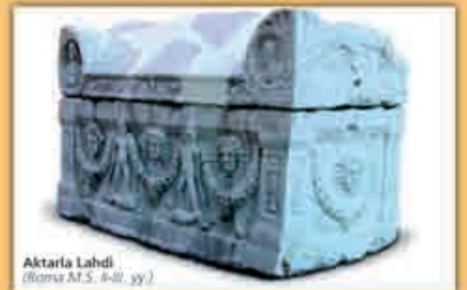
Aktarla Lahdi (Roma M.S. II-III. yy.)