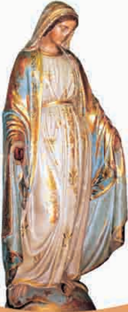
Meryem Ana Heykeli (Bizans Dönemi)