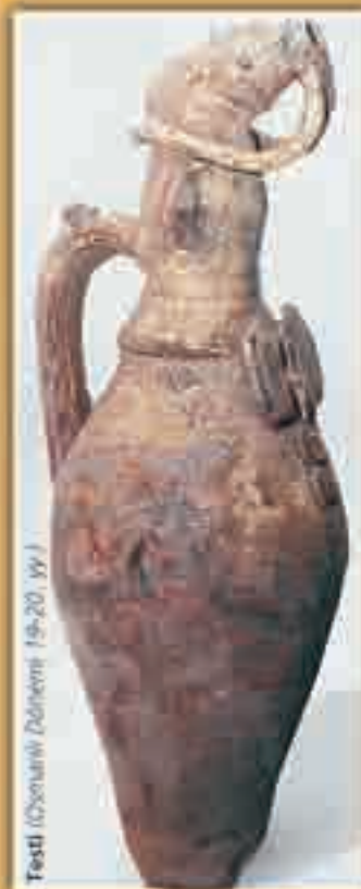
Testi (Köznarlı Dönem 19-20. yy.)