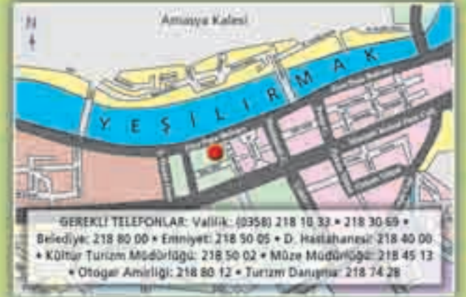
Amasya şehir planı

Mihrap, minber ve taçkapsı genel olarak sade olup, beyaz mermerden özenli biçimde yapılmıştır. İhtişamlı taç kapsi, kitabesi, silmeleri ve zengin stalaktitleri (sarkıtları) ile zarif ve özenlidir. Ayrıca ahşap pencere ve kapı kanatları, 15. yy. ahşap künkerekari tekniğinin en güzel örneklerindedir.