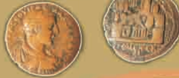
Roma Dönemi Amasya Şehir Sikkeleri (MS. 226)