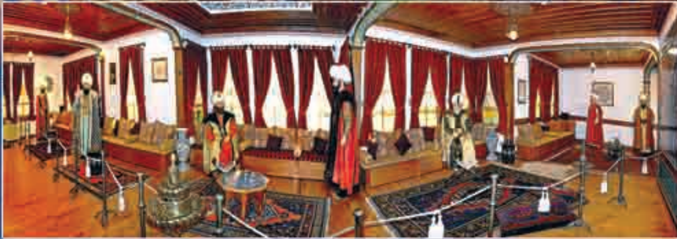
Yalıboynunda yeni alan Şehzadeler Evi Müzesi Amasya'da görev yapan Osmanlı Şehzadelerini ve Sultanlarını anılatıyor.

Günlük yaşam, evlerin iç mekânında köfe (havat) etrafında biçimlenen odalar içerisinde geçmektedir. Bu odalarda genellikle ocak, serbetlik, yükük (gömme dolap), raf ve sedir gibi lazevel birimler bulunmaktadır. Ayrıca birkaç örnek dışında evlerde bağımsız bir grasilhane (banyo) bulunmadığı için de bazı odalarda büyük ve geniş olarak düzenlenmiş olan yükükeler grasilhane olarak düzenlenmiştir.