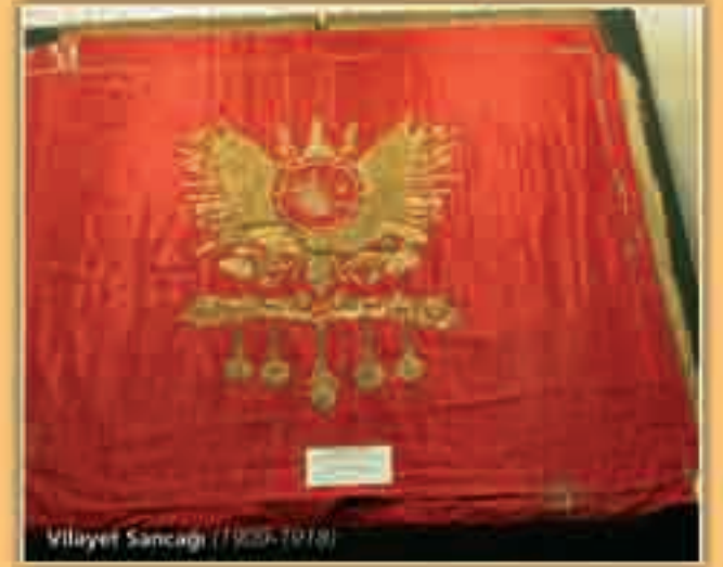
Vilayet Sancığı (1908-1918)