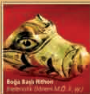
Boğa Başlı Ritton (Köznarlı Dönem M.Ö. I. yy.)