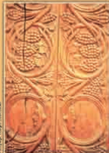
Ahşap Kapı Kovanı